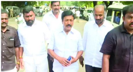
అన్నానగర్ న్యూస్: మదురైలో జరిగిన సమావేశంలో ముఖ్యమంత్రి ఎం.కె. స్టాలిన్ ను కించప